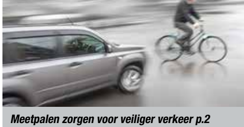
Meetpalen zorgen voor veiliger verkeer p.2