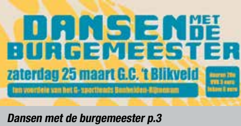
Dansen met de burgemeester p.3