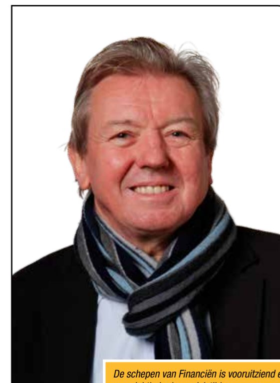
De schepen van Financiën is vooruitziend en voorzichtig in deze crisistijden.