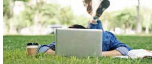
Digitale revolutie in Bonheiden p.3