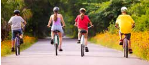
Partnerschappen voor fietsroutes p.2