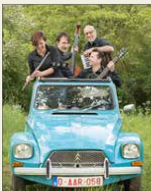
▲ Feest mee met Passe Partout op 10 juli.

Vier met ons mee en zorg ervoor dat Bonheiden-Rijmenam een kleurrijke gemeente wordt. Hang op 11 juli de Vlaamse Leeuw of de vlag van onze gemeente uit. Nog geen vlag? Stuur dan een mailtje met uw naam en adres naar geert.teughels@n-va.be en N-VA Bonheiden-Rijmenam bezorgt u gratis één of beide vlaggen.