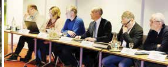
Nieuws uit de gemeenteraad (p.3)