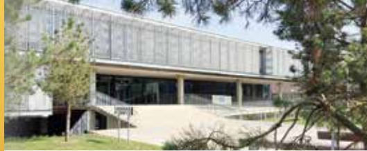
De afwezigen hebben ongelijk (p.2)